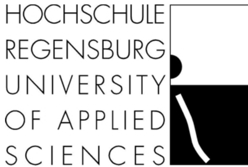
Abbildung A.3.: A-Frame aussen